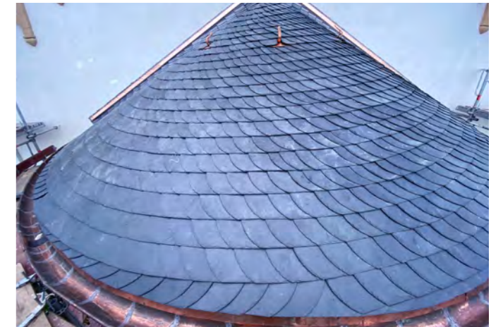
Kegelfläche altdeutsche Deckung (Kirche Laubach/Hunsrück)