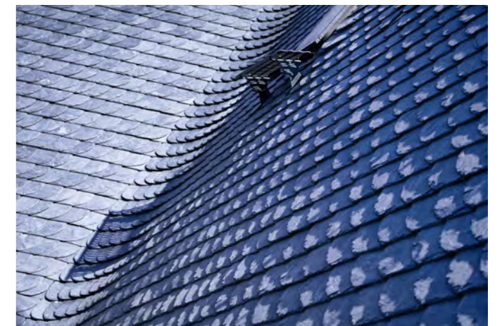
Kehldeckung Altes Rathaus Bonn-Oberkassel