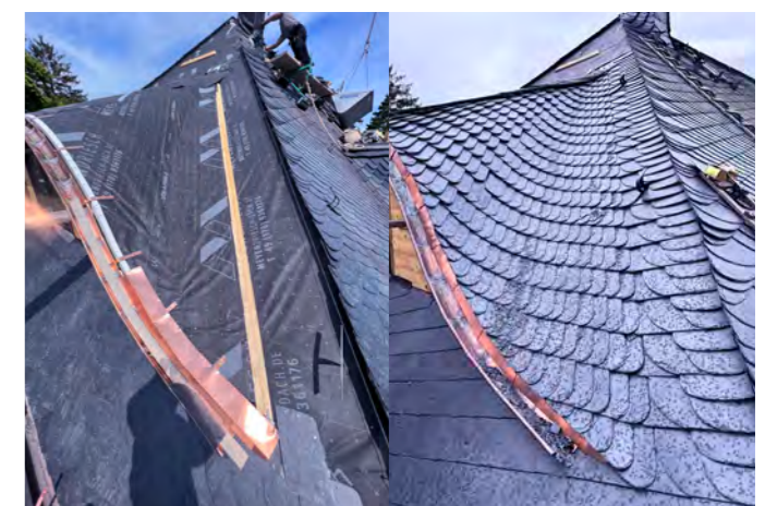
Umbau einer Gaube zur Fledermausgaube in Wiesbaden