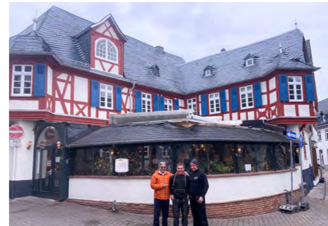
„Piccolo Mondo“ in Eltville/Rhein