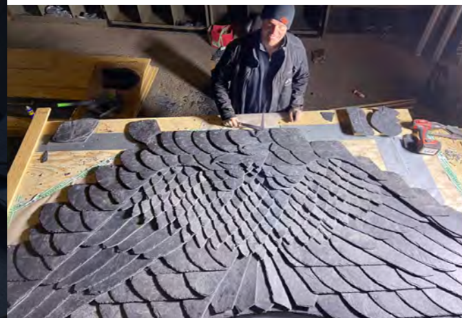
Adler-Ornament in Leideneck