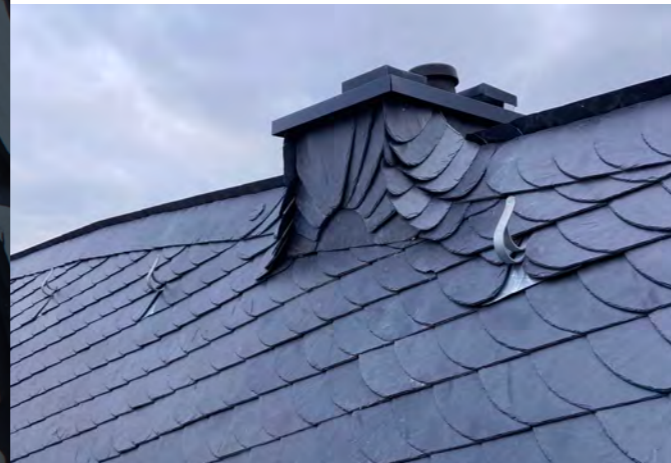
Schornsteinsanierung in Eltville/Rhein