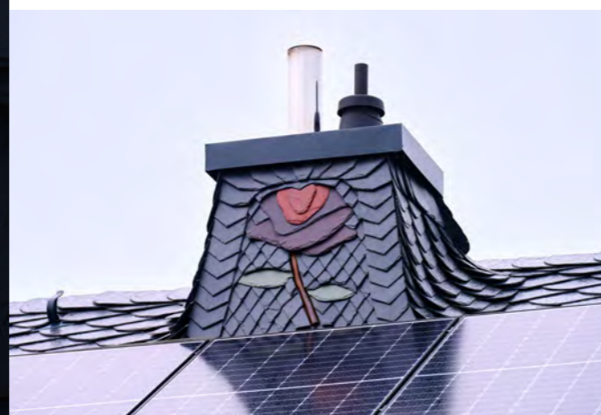
Rosen-Ornament in Kastellaun