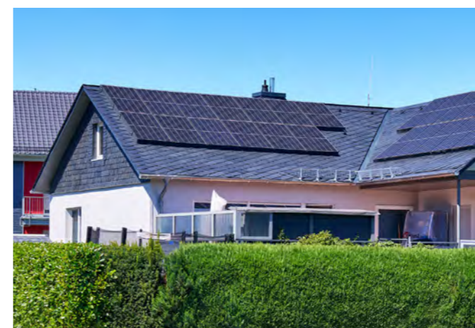
Schieferdach mit PV-Anlage in Kastellaun