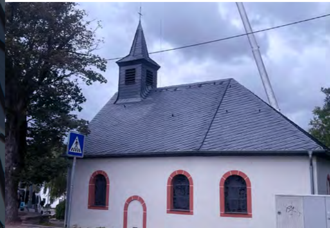
Kapelle in Püttlingen (Saarland)