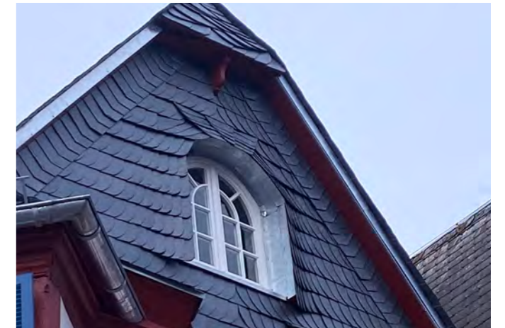
Giebfassade Restaurant „Piccolo Mondo“