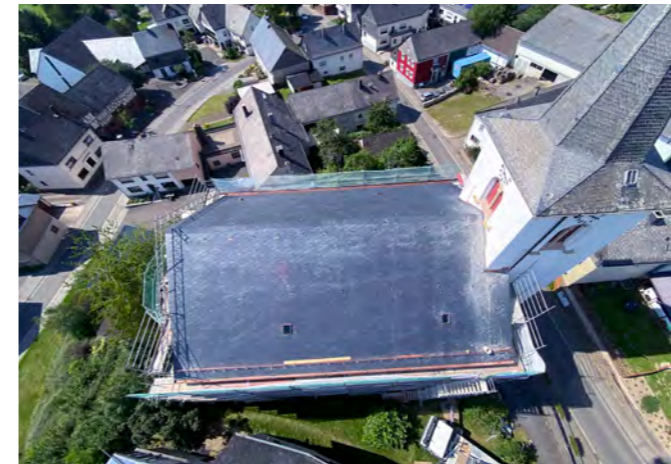
Kirche in Laubach (Hunsrück)