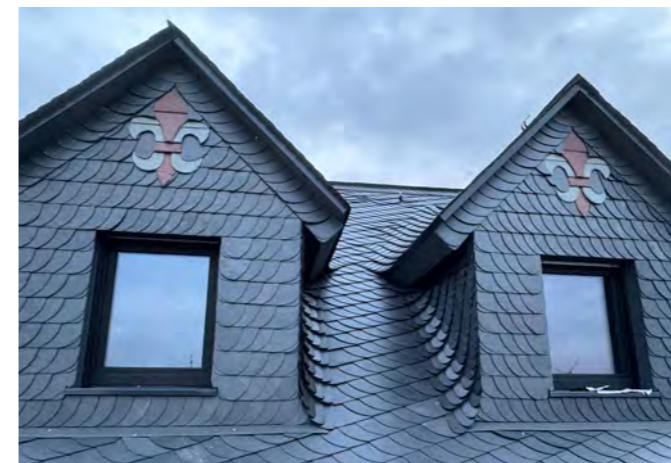
Heraldische Lilien in Leideneck